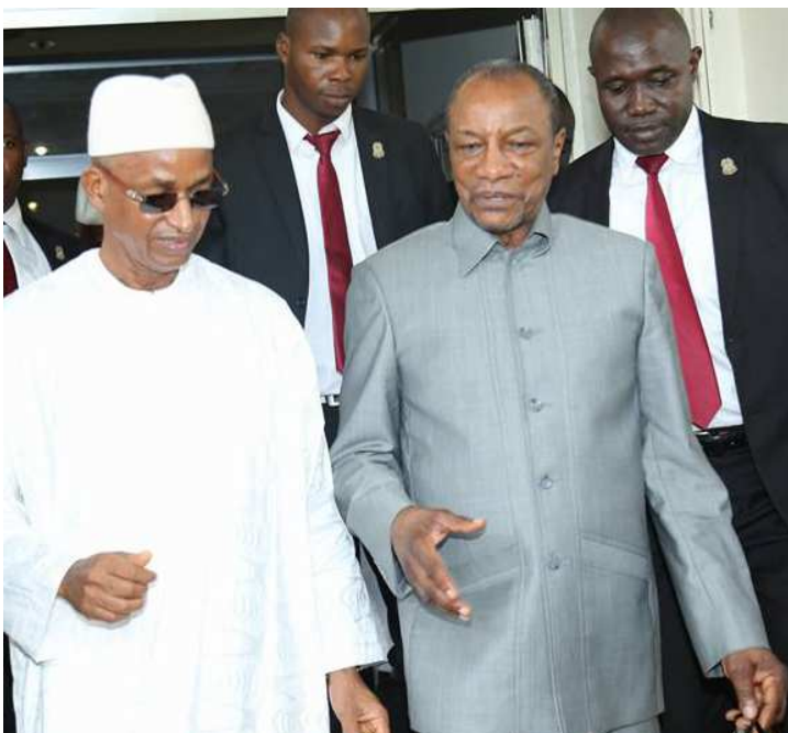
Cellou Diallo, candidat malheureux de la présidentielle de 2010 et de 2015, raccompagne le président Alpha Condé (candidat malheureux de la présidentielle de 1993 et de 1998) venu lui présenter ses condoléances suite au décès de son grand-frère.

Le chef de file de l'opposition a présidé samedi 3 décembre l'assemblée générale de son parti à son siège de Commandanya, dans la commune de Dixinn. Une réunion que Cellou Dalein Diallo a mise à profit pour s'attaquer à la gouvernance Condé caractérisée selon l'ancien Premier ministre par des détournements. D'entrée, le président de l'Union des forces démocratiques de Guinée a informé ses militants de l'évolution de l'Accord politique du 12 octobre relatif notamment à la révision du Code électoral. « Beaucoup d'entre vous sont préoccupés de la lenteur qui avait été enregistré à un moment donné dans la rédaction du Code électoral amendé et dans sa transmission à l'Assemblée nationale. Je dois vous informer que ce Code amendé est arrivé hier (vendredi 2, Ndlr) à l'Assemblée nationale », a-t-il indiqué devant une foule nombreuse de militants. M. Diallo a exprimé son penchant de rafler les 5 mairies de la capitale non sans