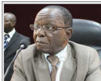
Le président Kondiano.