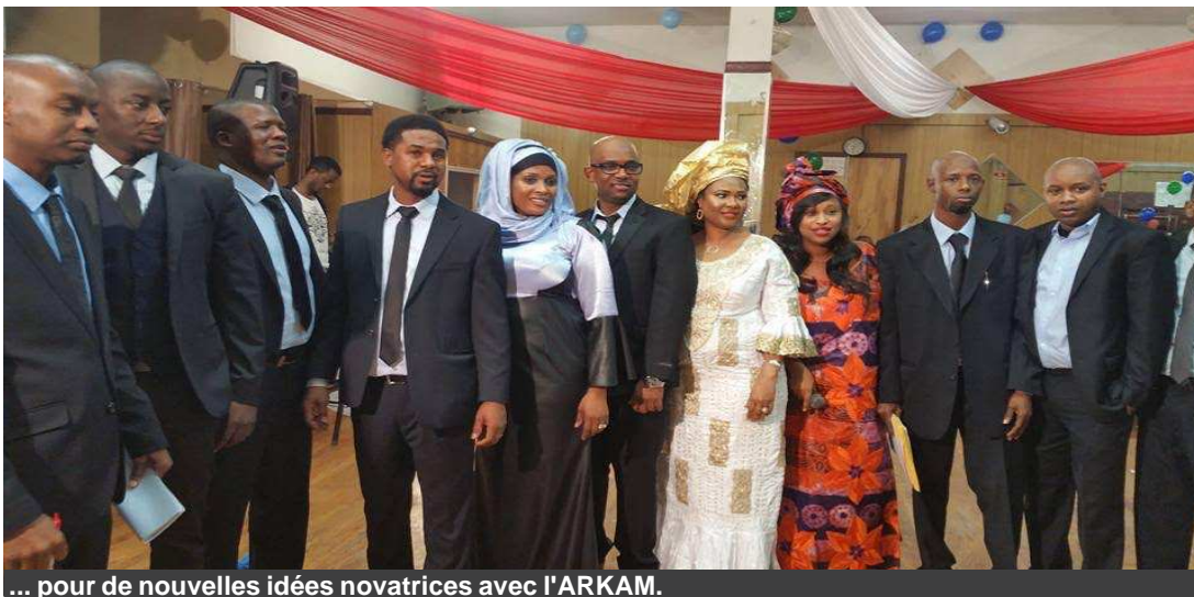
... pour de nouvelles idées novatrices avec l'ARKAM.

ans, l'association connaît des adhésions multiples et des supports variés de la part des organisations régionales et sous-régionales, préfectorales et sous-préfectorales, ONG communautaires, celles de la Société Civile et partis politiques.