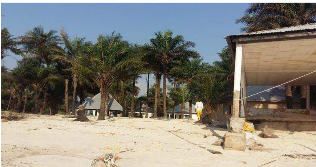
A Tayaki, c'est un seul instituteur qui dispense des cours à 42 élèves ...

Un peu plus loin, un autre habitant de la localité a été approché par notre reporter.