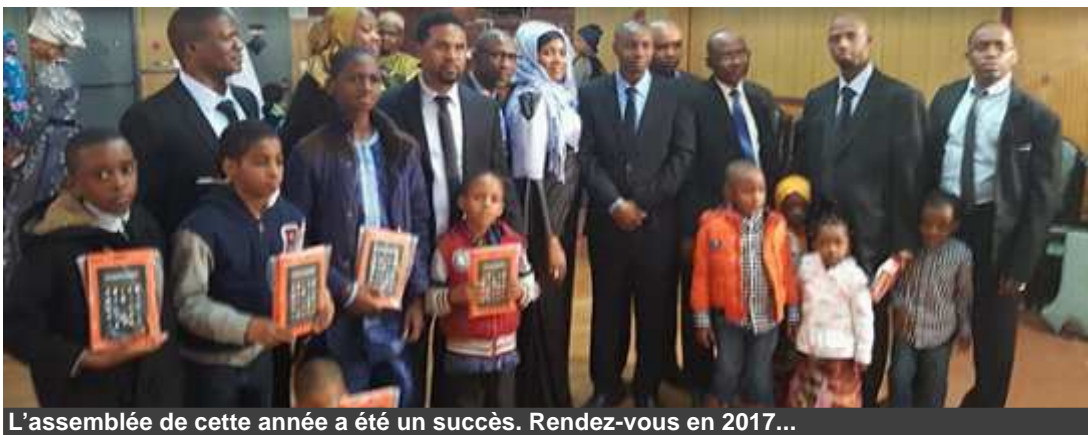
L'assemblée de cette année a été un succès. Rendez-vous en 2017...

Les points culminants de cette assemblée ont été la promotion des femmes pour leur implication dans les activités communautaires ainsi que l'éducation des enfants en langue Poular avec pour objectif le retour à la source pour cette jeune génération grandissante dans cette culture occidentale. Cependant, comme tout les