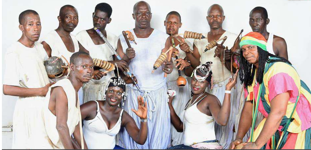
La troupe Djèrè Fouta, c'est le retour à l'authentique par et avec des instruments traditionnels fabriqués et joués par de vénérables maîtres de l'art du son et du rythme.

2 Croyez en vous ! Lancez vos projets ! Un arbre qui s'abat fait beaucoup de bruit ; une forêt qui germe, on ne l'entend pas. Gandhi