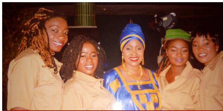
L'animatrice de l'émission (au centre) contribue à la promotion de la gent féminine.