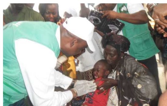
La rougeole touche surtout les enfants. Elle est caractérisée par la fièvre, l'éruption cutanée, une conjonctivite, un rhum et une toux qui en restent les principaux symptômes.