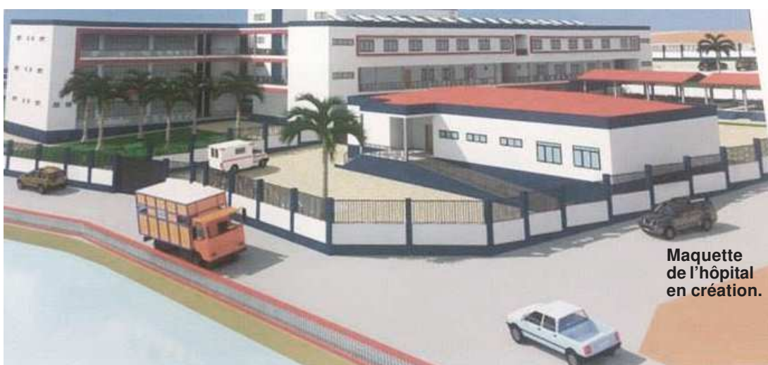
Maquette de l'hôpital en création.