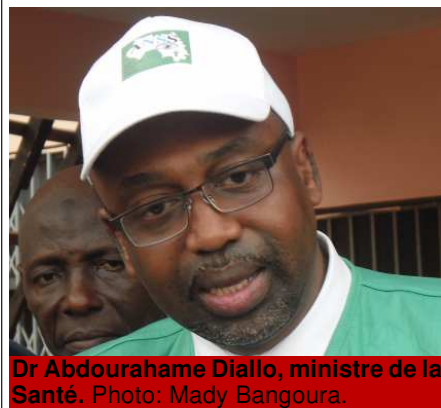
Dr Abdourahame Diallo, ministre de la Santé.

ment été lancée jeudi 6 avril à la mairie de Ratoma. C'était à la faveur d'une cérémonie qui a regroupé plusieurs couches sociales du pays.