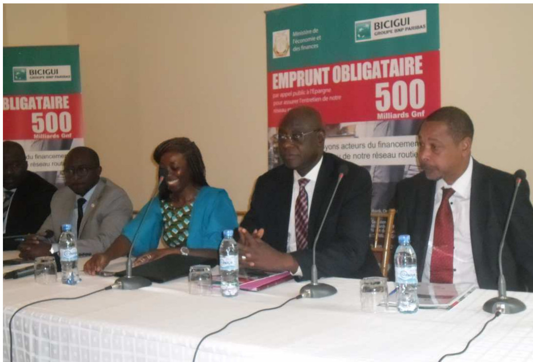
Ils étaient présents, les ministres du Budget, des Finances, le gouverneur de la BCRG et le chef de file du syndicat de placement de l'emprunt obligataire.

Dans le souci de répondre aux défis se posant aux infrastructures routières guinéennes, notamment avec la dégradation très avancée des voiries urbaines et de certains axes routiers de première importance en vue d'un confort pour les populations et le transport des marchandises, mais aussi les difficultés rencontrées dans la mobilisation rapide des ressources financières traditionnelles de l'Etat et des concours extérieurs, l'Etat s'est proposé d'émettre un emprunt obligataire destiné à financer les travaux d'urgence dans le domaine des infrastructures routières.