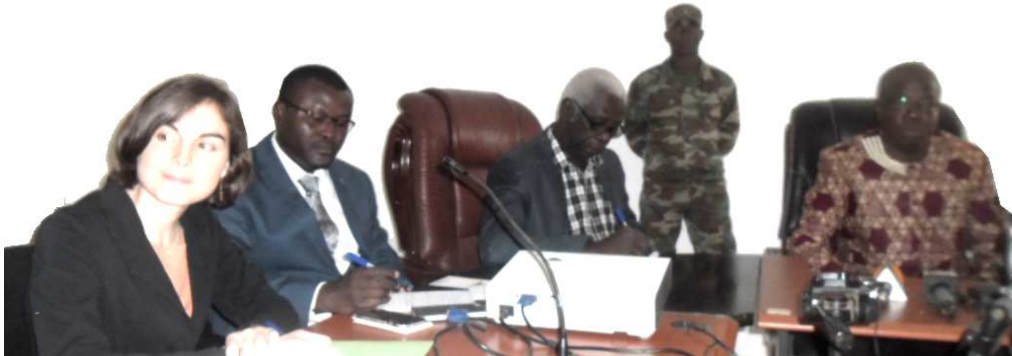
Ministère des Pêches, mardi 28 mars 2017. Le ministre André Loua en conclave avec les experts.

Une réunion d'échanges sur le processus d'intégration de la Guinée à l'Initiative de transparence dans les industries de pêche s'est tenue du mardi 28 au mercredi 29 mars à Conakry, avec pour objectif, établir plus de lumière dans le secteur maritime.