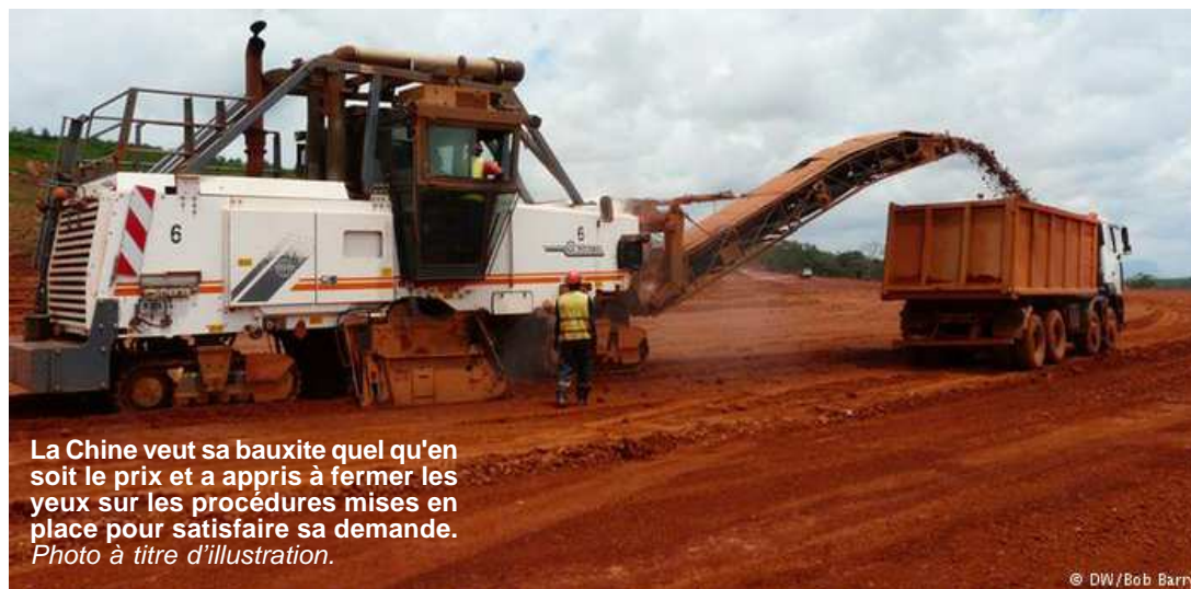
La Chine veut sa bauxite quel qu'en soit le prix et a appris à fermer les yeux sur les procédures mises en place pour satisfaire sa demande. Photo à titre d'illustration.

Sans forcément pointer du doigt les accords commerciaux qui lient aujourd'hui la Chine et la Guinée sur le terrain de la bauxite, le passif chinois en la matière peut inquiéter quant aux conséquences environnementales que cette demande massive pourrait causer sur le sol africain. ■