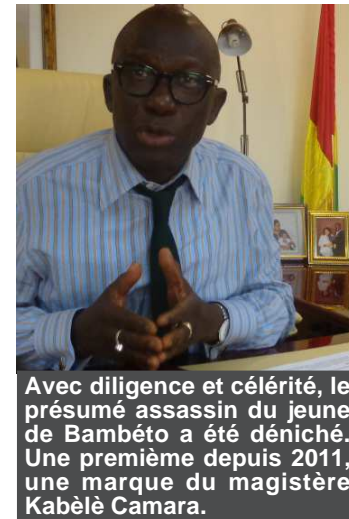
Avec diligence et célérité, le présumé assassin du jeune de Bambéto a été déniché. Une première depuis 2011, une marque du magistère Kabèlè Camara.

«Tout s'est bien déroulé au début. Fort malheureusement aux environs de 17h 30, un trouble à l'ordre public s'est produit aux alentours du rond-point de Bambéto entraînant l'intervention de la deuxième section de la CMIS de Bambéto. Au cours de cette intervention, deux cas de blessure graves par balles, dont un mortel, ont été enregistrés», a indiqué le ministre Kabèlè Camara.