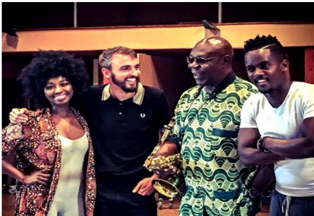
Inna Modja, Christophe Willem, Manu Dibango et Black M.

L'hymne a fait tilt chez les francophiles. «Fier de représenter la Francophonie», écrit Black M sur son compte Instagram avant de se rendre au Brésil où, à la grande satisfaction des spectateurs et membres des délégations nationales, il a pris part à la