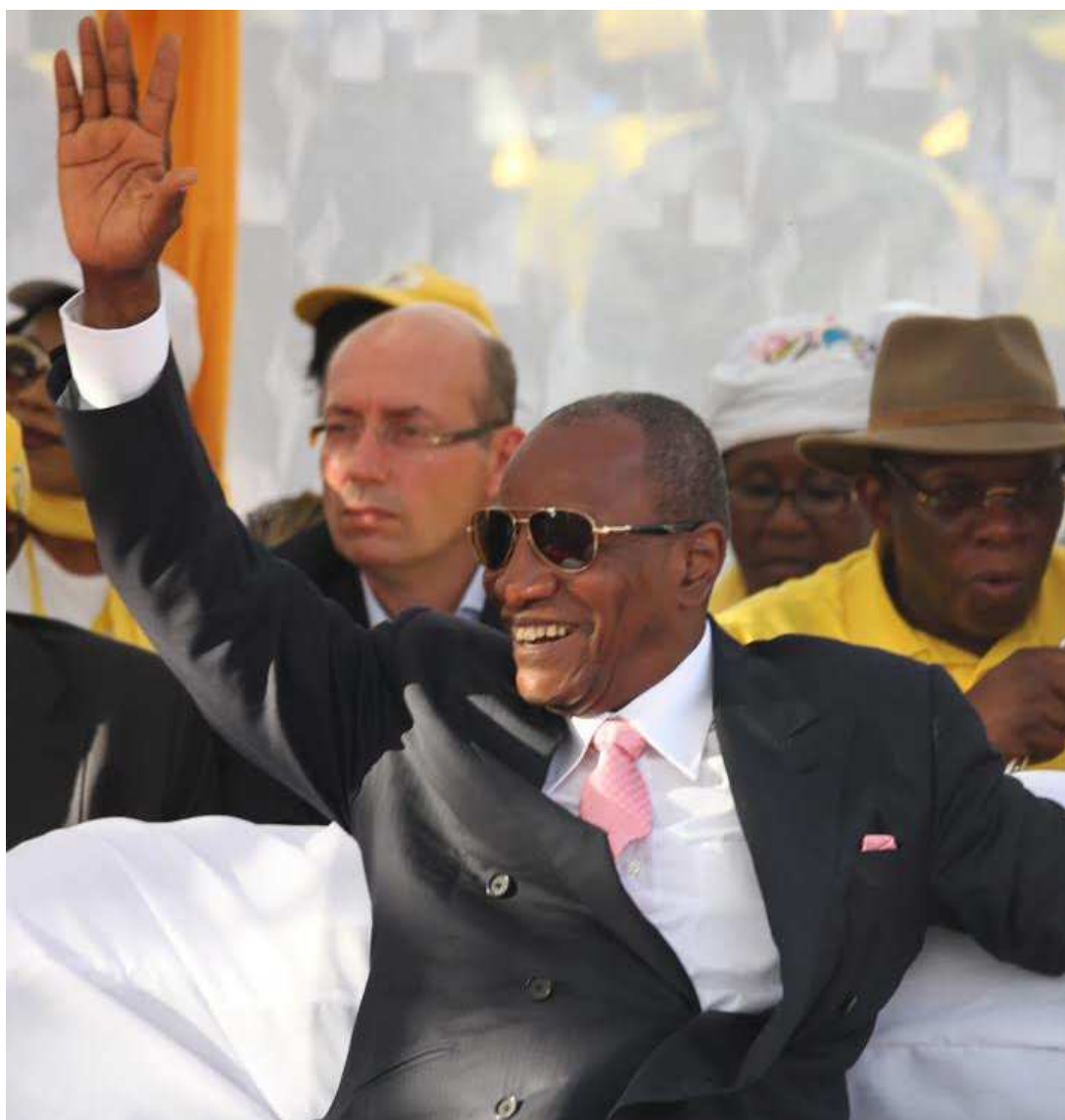
Alpha Condé, président de la République de Guinée.

Mais qui est Samuel Mebiame ? Fils d'un ancien premier ministre gabonais, cet homme d'affaires, on se rappelle, avait déclaré en 2013, lors d'un entretien avec l'ancien ministre des mines guinéen, Mahmoud Thiam qu'Alpha Condé "trahit systématiquement tous ceux qui l'ont aidé. Je l'ai aidé entre les deux tours (présidentielle de 2010, NDLR), à deux reprises, je lui ai fait livrer 3 ou