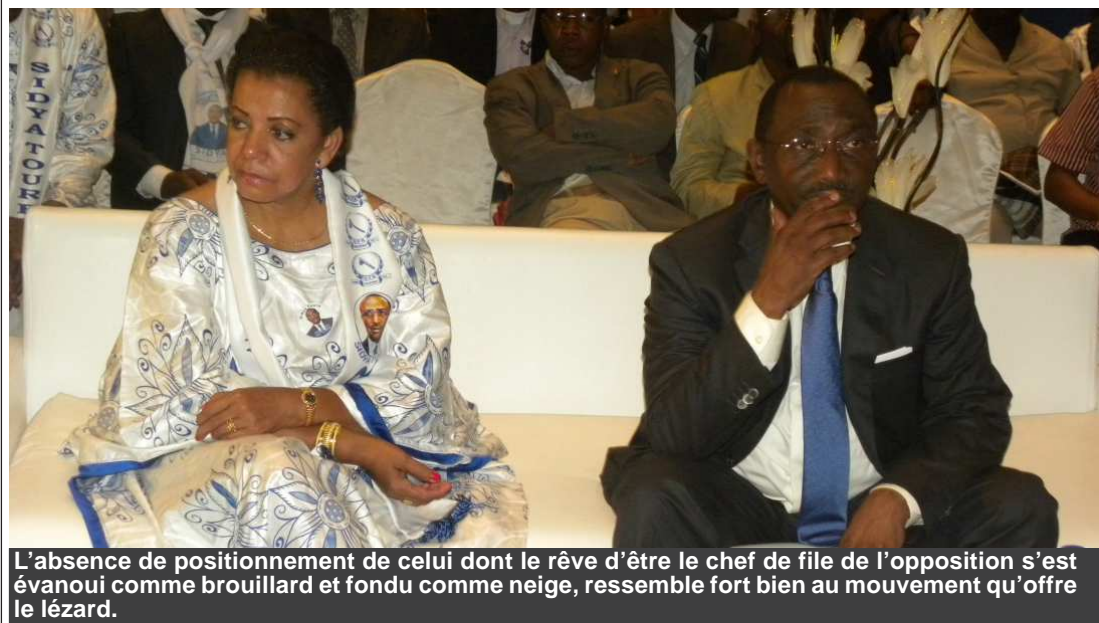
L'absence de positionnement de celui dont le rêve d'être le chef de file de l'opposition s'est évanoui comme brouillard et fondu comme neige, ressemble fort bien au mouvement qu'offre le lézard.

Suisse: « Pour quoi je suis politiquement d'obédience libérale. Entre les partis généralement de droite qui incitent et encouragent l'État à favoriser une meilleure redistribution des ressources et ceux, généralement de droite, qui incitent l'État à favoriser plutôt, la création de richesses par l'encouragement et la promotion de l'initiative privée, sans aucune hésitation, mon choix politique s'est porté sur les seconds. Ce choix s'explique par le fait que je suis convaincu que l'État ne peut avoir comme rôle de nourrir les gens plutôt que de les aider à être à même de pouvoir se nourrir eux-mêmes. Sachant après tout, que c'est la production qui précède la distribution et non l'inverse. Cette vision politique a, entre autres, pour mérites, de favoriser la prévention et l'anticipation de la dépendance à l'État que de se focaliser sur les mesures que l'État doit envisager pour pouvoir prendre en charge et gérer les conséquences des éventuelles dépendances des uns et des autres à son égard. Bien que garant de l'intérêt général, l'État ne doit pas être dans le faire, mais dans le faire-faire qui garantit et accorde les mêmes chances à tous les citoyens. »