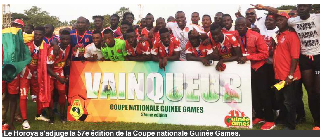
Le Horoya s'adjuge la 57e édition de la Coupe nationale Guinée Games.

Soumise à une rude épreuve devant les accélérations du Horoya, c'est avec beaucoup de