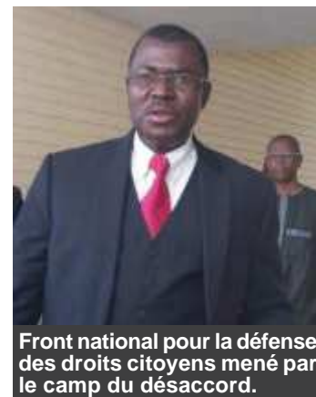
Front national pour la défense des droits citoyens mené par le camp du désaccord.

national (PEDN) de Lansana Kouyaté et l'Union guinéenne pour la démocratie et le développement (UGDD) de feu George Gandhi Faraguet Tounkara . L'incarnation de la 4e force politique motive la démarche par ce qui suit. «C'est un droit accordé au peuple de Guinée par la Constitution de la République. Parce qu'on s'est rendu compte que ce sont des accords qui engagent certes les deux plus grands partis de notre pays, mais qui sont contre le peuple