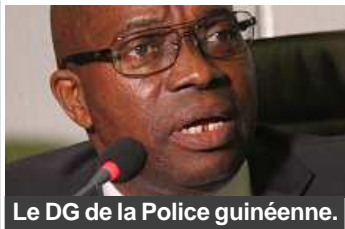
Le DG de la Police guinéenne.

Décidément, Nzérékoré est en passe de devenir un terreau fertile aux propos anti-démocratiques qui foulent au sol des acquis obtenus de longues et funèbres luttes par le peuple de Guinée au prix de plusieurs centaines d'âmes humaines.