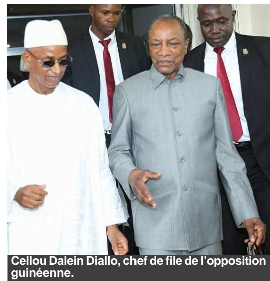
Cellou Dalein Diallo, chef de file de l'opposition guinéenne.