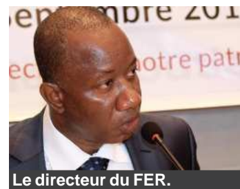
Le directeur du FER.