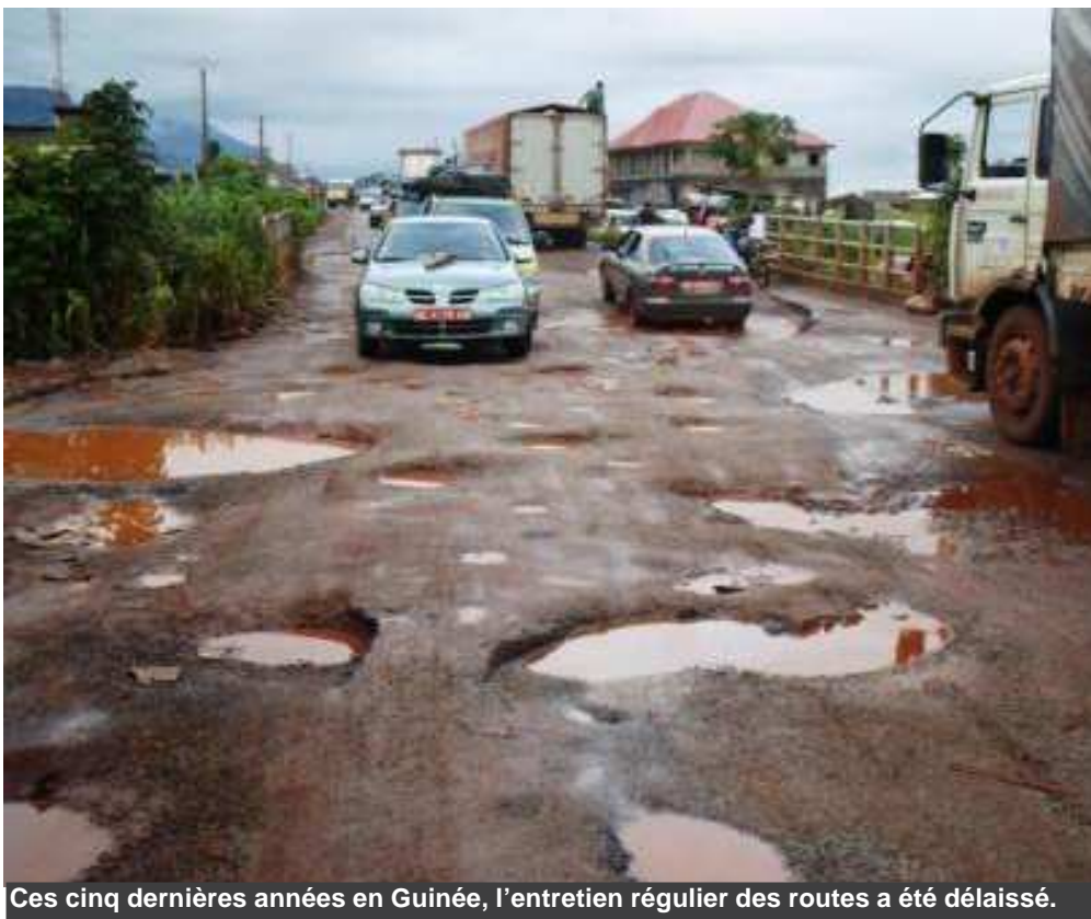
Ces cinq dernières années en Guinée, l'entretien régulier des routes a été délaissé.