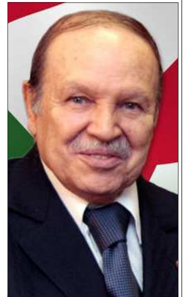
Le président algérien Abdelaziz Bouteflika.

l'Algérie étant l'un des pays qui possèdent les plus grands gisements du monde en matière d'énergie solaire. Dans l'intervalle, les énergies fossiles comme le pétrole et le