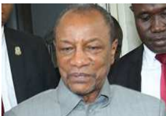
Pr Alpha Condé, chef de l'Etat.

Cette décision d' Aziz Diop est consécutive aux scènes de violences auxquelles les autorités ont assisté ces derniers temps lors des