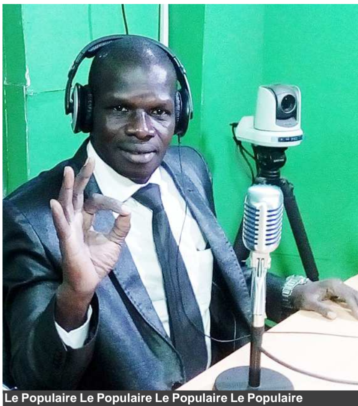
Le Populaire Le Populaire Le Populaire Le Populaire

« Vous le savez depuis qu'il (Alpha Condé, Ndlr) est là, on a enterré combien de guinéens? Il y a des détournements dont on ne connaît même pas le nombre. L'état des routes est une autre catastrophe. Je vous fais des révélations : à chaque