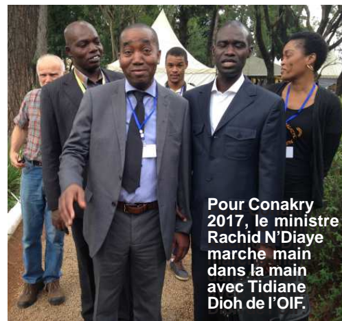
Pour Conakry 2017, le ministre Rachid N'Diaye marche main dans la main avec Tidiane Dioh de l'OIF.

L'honneur est maintenant à Conakry. La capitale guinéenne a un an pour se préparer à recevoir pour la première fois de son histoire plus de 300 dirigeants, responsables de rédaction des médias et journalistes de l'espace francophone. ■