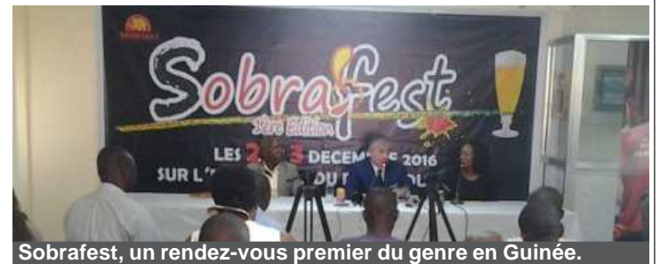
Sobrafest, un rendez-vous premier du genre en Guinée.