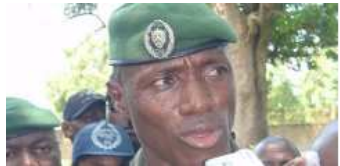
Le colonel Tiégboro ne badine plus avec les chichis de la chicha

Le Secrétaire général à la Présidence chargé des Services spéciaux de la lutte anti-drogue et le crime organisé, le colonel Moussa Tiégboro Camara, au sortir d'un conclave avec le ministre du Commerce et celui de la Santé a annoncé jeudi 19 janvier 2017 les dispositions prises pour lutter contre la consommation de la chicha en République de Guinée. Une commission, instituée à cet effet, a recommandé la constitution d'une équipe pluridisciplinaire et multisectorielle chargée d'initier et de mettre en œuvre, à l'échelle nationale, un projet d'information, d'éducation et de communication (IEC) contre l'importation, la commercialisation et la consommation de la substance toxique sur toute l'ensemble du territoire national, ainsi que le dépôt volontaire des stocks de chicha et accessoires durant les 48 heures au siège du Secrétariat général à la Présidence chargé des Services spéciaux de la lutte contre la drogue et le crime organisé, sis à Coronthie, à Kaloum. Sous peine de poursuite de tout contrevenant aux présentes dispositions.