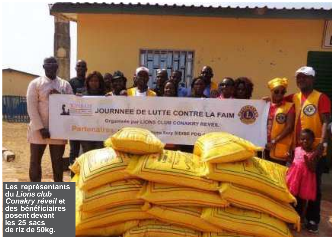
Les représentants du Lions club Conakry réveil et des bénéficiaires posent devant les 25 sacs de riz de 50kg.