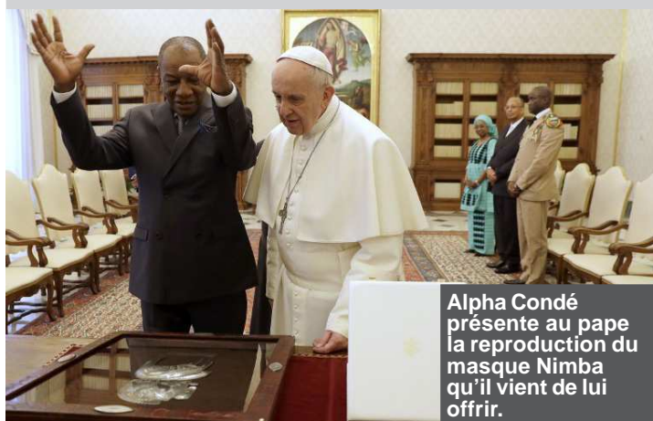
Alpha Condé présente au pape la reproduction du masque Nimba qu'il vient de lui offrir.

abordée, « avec une référence particulière à l'engagement concret de la République de Guinée pour contribuer à sa pacification ».