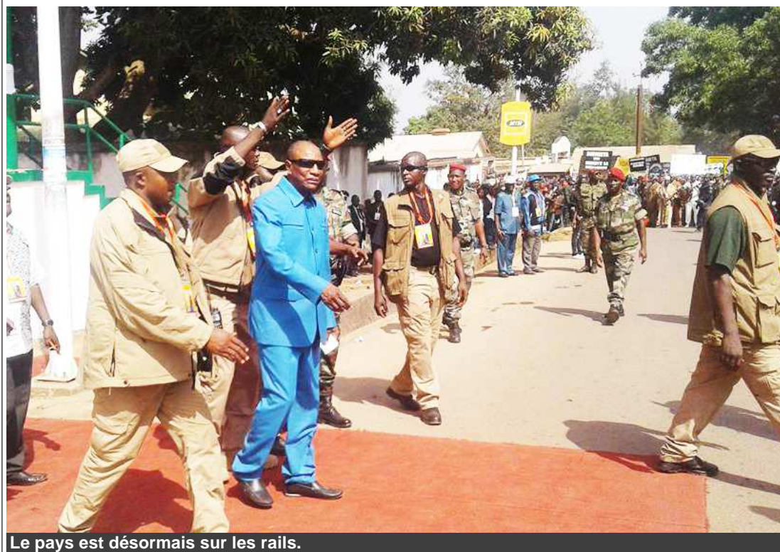
Le pays est désormais sur les rails.

Nationale de la République Populaire de Chine. Une portière s'ouvre, une présence : celle du président Alpha Condé chez son homologue chinois Xi Jinping, le mercredi, 2 Novembre 2016. Deux chefs d'Etat qui ont une même volonté, celle de renforcer l'axe de coopération Conakry-Beijing. C'est le principal objectif de cette visite d'Etat que le Président de la République Populaire de Chine a accordé à son homologue guinéen, le Pr. Alpha Condé. Les discussions sont riches, et les domaines de coopération variés, au cours de cette rencontre bilatérale entre les délégations de la Chine et de la Guinée, pays riche en ressources minières, énergétiques et agricoles. Les présidents Alpha Condé et Xi Jinping ont évoqué plusieurs questions de développement socioéconomiques dans le but de raffermir les relations d'amitié et de coopération sino-guinéennes. Ces discussions qui ont duré plus d'une heure d'horloge ont débouché sur la signature de plusieurs accords de coopération. Des accords qui embrassent tous les domaines de la vie socioéconomique et politique. 10 accords ont été, à cet effet,