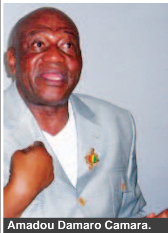
Amadou Damaro Camara.

Dans cette interview, le président du groupe parlementaire de la majorité présidentielle parle de l'actualité politique marquée par la rupture entre le RPG Arc-en-ciel et l'UDG d'Elhadj Mamadou Sylla "Patronat" et des élections communales. L'honorable Amadou Damaro Camara aborde aussi la crise gambienne dont il dit être en faveur d'une résolution par voie diplomatique.