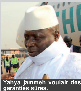
Yahya jammeh voulait des garanties sûres.

Il aura fallu une négociation au forceps du président Alpha Condé et son homologue mauritanien Abdel Aziz pour convaincre Yahya Jammeh désormais seul contre tous à prendre le chemin de l'exil. En réalité, il n'y avait pas d'autres alternatives pour l'ancien président gambien. La seule variante était de partir mais comment ? En réalité, devenu infréquentable, lâché de toute part, Yahya Jammeh voulait des garanties sûres.