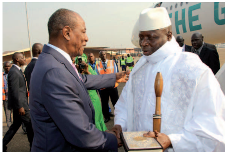
La démocratie est sauvée, la diplomatie guinéenne triomphe.

Sollicité dans la crise gambienne, le président Alpha Condé vient de réussir une mission saluée par l'opinion publique nationale et internationale. Puisqu'il a réussi, en compagnie de son homologue du Niger, à faire déclarer à Yahya Jammeh sa volonté de céder le fauteuil présidentiel au président élu Adama Barrow.