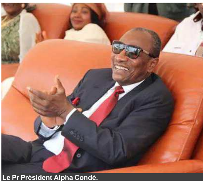
Le Pr Président Alpha Condé.

Le message est entendu et bien perçu par toutes ces personnalités qui ont su vite réagir. C'est pourquoi, au cours du sommet des chefs d'Etats et de Gouvernement de l'Union africaine dans la capitale éthiopienne, les dirigeants du continent ont porté leur confiance en le Pr. Alpha Condé, désigné comme coordinateur en charge des énergies renouvelables pour l'Afrique. Ceci, compte tenu du leadership et de la volonté affichés par le chef de l'Etat guinéen dans le cadre du développement du domaine énergétique. Comme exemple illustratif sur le plan national, la construction du barrage hydroélectrique de KALETA en l'espace de deux ans et demi. Une infrastructure énergétique qui a permis de sortir une bonne partie du pays de l'obscurité. Un acte d'envergure qui, sans nul doute, a amené ces personnalités du continent à choisir le Président Alpha Condé pour gérer ce dossier des énergies renouvelables avec un seul objectif : mobiliser les ressources nécessaires, auprès des bailleurs de fonds, afin de les injecter dans les grands projets énergétiques du continent. Les déplacements du Président de la République, coordinateur des énergies renouvelables pour l'Afrique, s'enchaînent au bénéfice du continent et de son pays. Le Pr. Alpha Condé est en Arabie Saoudite pour une visite d'Etat. Il est avec le serviteur des deux saintes mosquées, sa Majesté Salman Ben Abdel Aziz Al Saoud, qui échange avec lui sur le renforcement de l'axe de coopération Conakry-Riyad. Plusieurs résultats allant dans