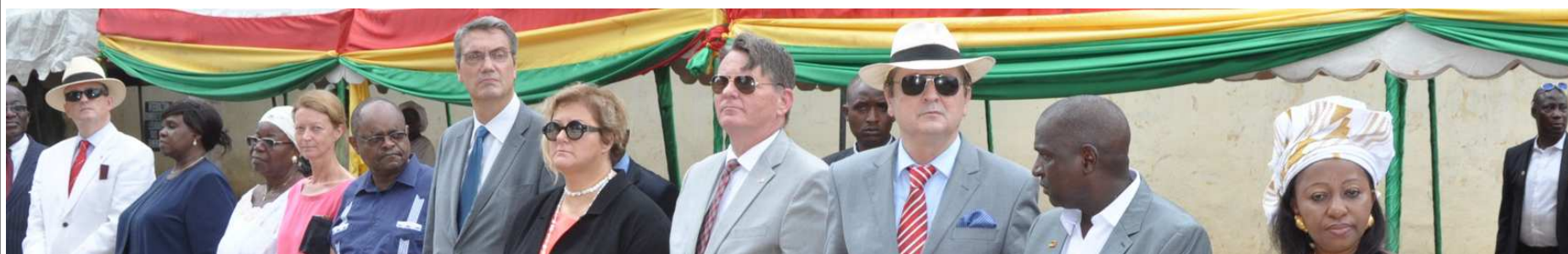
En ne respectant pas les engagements qu'il prend, le régime Alpha Condé trompe les espérances de l'opposition, mais aussi des ambassadeurs, et des principaux représentants de la communauté internationale en République Guinée.