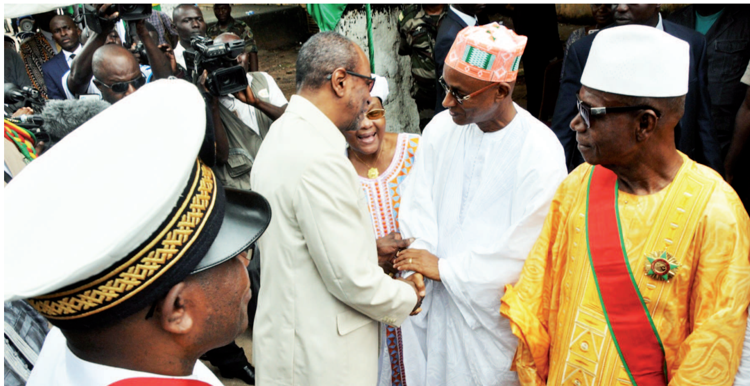
Ce n'est qu'après avoir mobilisé près d'un million de personnes dans les rues de Conakry le 16 août 2016 que le chef de file de l'opposition a réussi à contraindre le président Alpha Condé au dialogue qui a abouti à l'Accord politique du 12 octobre 2016.

Le chef de file de l'opposition guinéenne tient Alpha Condé pour le seul responsable de la violation de l'Accord politique du 12 octobre.