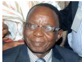
Le président du Parlement, Kory Kondiano.

avoisinant 600 millions de FG pour payer en complément de cotisation de retraite à la Banque centrale. Il a travaillé à la Banque centrale. Il n'a aucune ressource par le passé. Et il n'a pas pu s'acquitter de ses cotisations. C'est maintenant une aubaine pour lui de soustraire de l'argent du budget de l'Assemblée», révèle le parlementaire. L'opposant, et par ailleurs président de la commission Budget de l'Assemblée, estime que la gestion est faite dans une grande opacité. «Nous ne pouvons pas comprendre