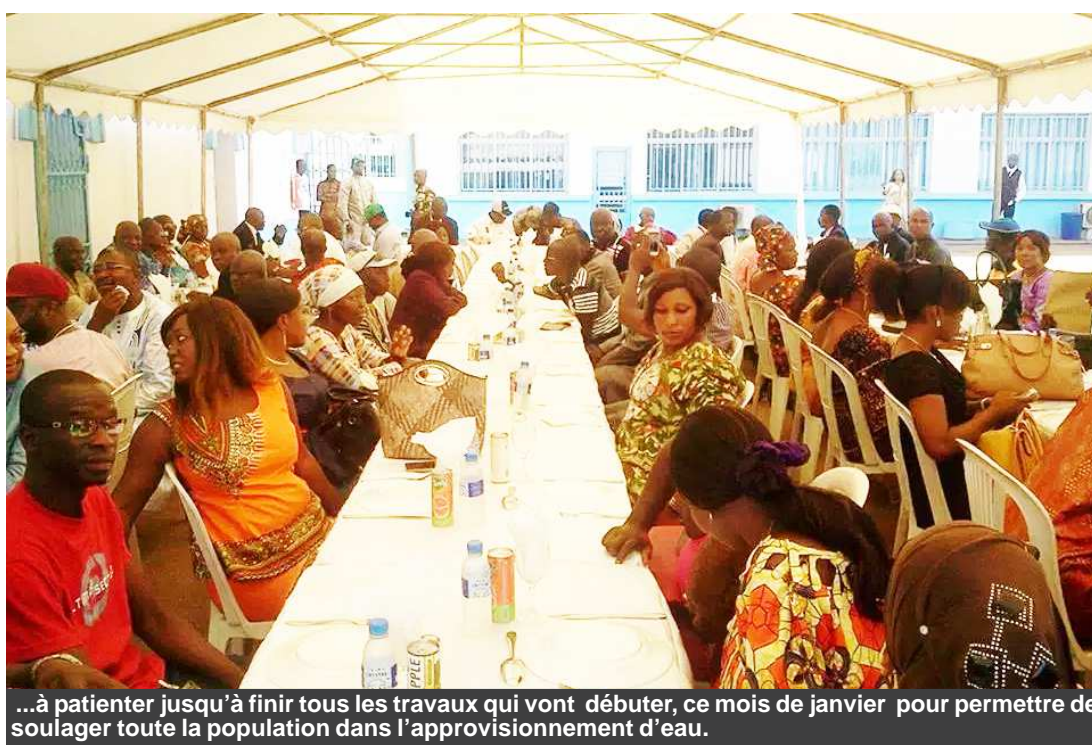
...à patienter jusqu'à finir tous les travaux qui vont débuter, ce mois de janvier pour permettre de soulager toute la population dans l'approvisionnement d'eau.