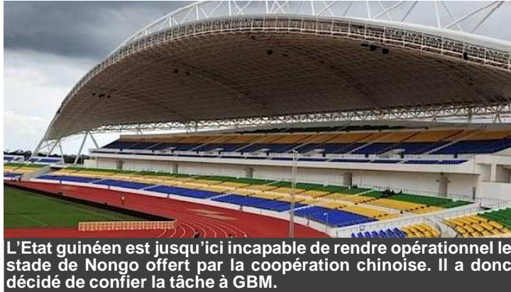
L'Etat guinéen est jusqu'ici incapable de rendre opérationnel le stade de Nongo offert par la coopération chinoise. Il a donc décidé de confier la tâche à GBM.

La nouvelle année débute bien sur le plan sportif. Une convention signée entre les autorités et une entreprise locale convient de la gestion privée du stade de Nongo, fruit de la coopération guinéo-chinoise et qui peine à être achevée depuis près d'une décennie.