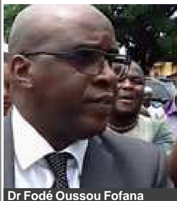
Dr Fodé Oussou Fofana

A l'occasion de la nouvelle année 2017, mes premières pensées vont à toutes celles et à tous ceux parmi vous qui sont en proie aux rudes épreuves de la vie, à la détresse et aux incertitudes du quotidien. Je partage leurs peines et leurs souffrances. Je les exhorte à puiser dans la compassion de la nation les indispensables ressources de l'espoir et du réconfort, afin que l'année 2017 leur soit légère et supportable. Le passage d'une année à une autre est toujours un grand moment dans une vie puisqu'il permet de mesurer le chemin parcouru et de formuler des vœux et des projets d'avenir. C'est souvent aussi le moment des bilans pour ceux qui ont choisi d'agir pour la cause commune de leurs peuples afin d'évaluer les points forts et les points faibles de leurs actions. Je voudrais humblement associer ma modeste voix à celles des milliers d'autres personnes pour souhaiter à chacune et chacun de vous une très bonne année 2017. Qu'elle soit une année de restauration individuelle et collective. Je voudrais vous remercier sincèrement pour votre mobilisation autour du