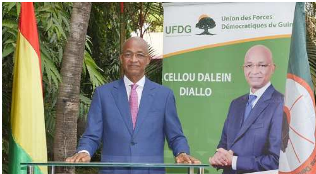
Cellou Dalein Diallo: «La mauvaise gouvernance qui prévaut actuellement constitue un réel danger pour l'avenir de notre pays.»

Mes vœux de 2017 vont également à nos mères, épouses,