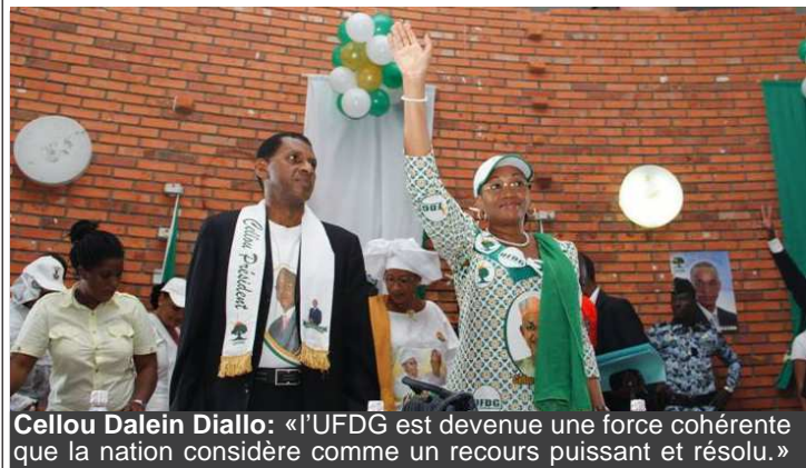
Cellou Dalein Diallo: «L'UFDG est devenue une force cohérente que la nation considère comme un recours puissant et résolu.»

C'est pourquoi, fidèle à mes convictions et soucieux de l'avènement d'un Etat plus juste, je n'ai cessé de dénoncer, les transactions douteuses avec les multinationales intervenant dans nos mines et la violation récurrente des règles de passation des marchés publics.