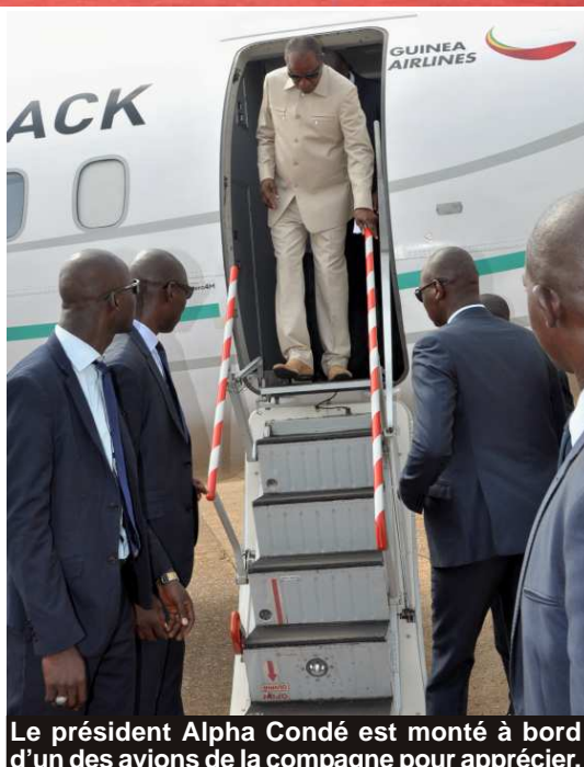
Le président Alpha Condé est monté à bord d'un des avions de la compagnie pour apprécier.

On avait tant besoin après le bradage de la défunte Air Guinée . Un homme d'affaires de l'époque avait été propriétaire de toute la logistique et tout le patrimoine de ce fleuron de la République sans que la réalité ne soit jamais connue.