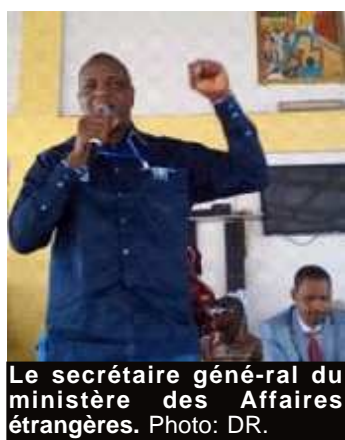
Le secrétaire général du ministère des Affaires étrangères.

« Il est (donc) temps que le Rpg Arc-en-ciel se prépare au-delà de 2020. Il faut que le Rpg Arc-en-ciel s'organise pour vivre pendant au moins 50 ans à la tête de ce pays. Cela est pos-