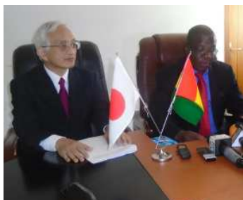
L'ambassadeur et le ministre en charge de la Pêche.