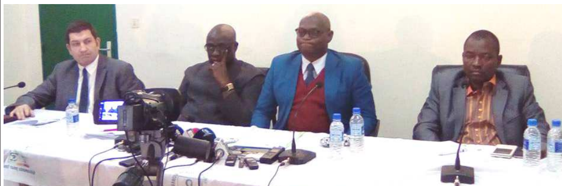
Le directeur de la Pharmacie centrale a annoncé l'événement le 25 février.

Conakry abritera de ce mercredi 1er à ce vendredi 3 mars la 19e assemblée générale de l'Association africaine des centrales d'achats de médicaments essentiels (Acame) et les 2es journées pharmaceutiques de Guinée (Jpg). Durant ces jours, les panelistes venus d'Afrique et de France,