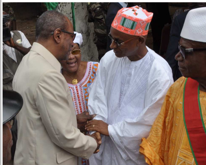
Il ne reste plus que la course à l'examen de la Constitutionnalité du Code amendé, puis du choix du chronogramme électoral par l'ensemble des acteurs du processus.

Ce jeudi 23 février 2017, le nouveau Code électoral a été adopté par une écrasante majorité des voix à l'Assemblée nationale. L'Ufdg et le Rpg Arc-en-ciel se frottent les mains, en attendant de retrousser les manches pour les prochaines étapes du processus devant conduire aux élections. Seuls des membres d'un micro-collectif de perfides épiluchures politiques ont piqué, toute honte bue, une colère noire.