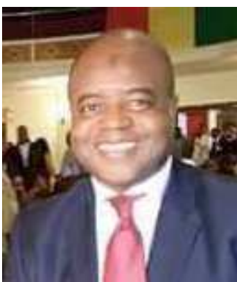
Alpha Saliou Wann Président de l'AFD

* Les recours formés contre les actes du président de la République pris en application des articles 2, 45, 74 et 90, ainsi que les recours formés contre les ordonnances prises en application de l'article 82, sous réserve de leur ratification. Nous sommes fondés à saisir la Cour Constitutionnelle pour défendre nos droits garantis par la Constitution en son article 21 alinéas 2 et 3 qui dispose : Le peuple de Guinée a un droit imprescriptible sur ses richesses. Celles-ci doivent profiter de manière équitable à tous les Guinéens. Il a droit à la préservation de son patrimoine, de sa culture et de son environnement.