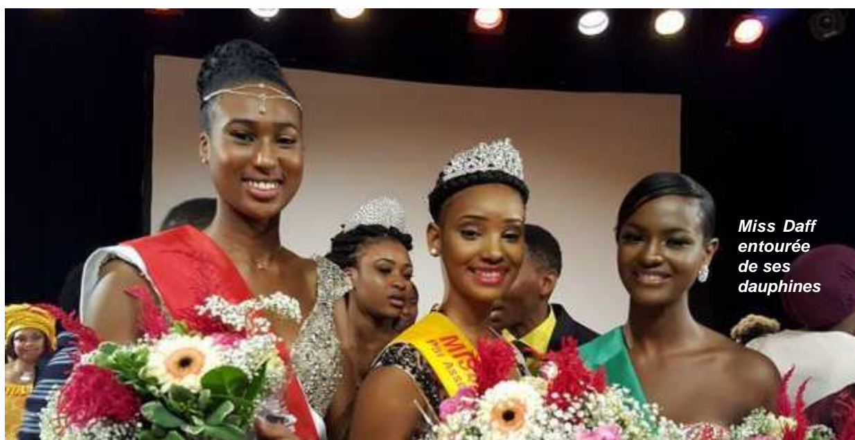
Miss Daff entourée de ses dauphines