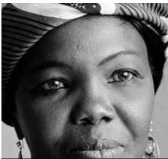
Jeanne Martin Cissé, première femme à présider le Conseil de sécurité de l'ONU.

Jeanne Martin Cissé n'est plus ! La première femme à avoir présidé le Conseil de sécurité des Nations-Unies en 1972, est décédée mardi 21 février à l'âge de 91 ans.