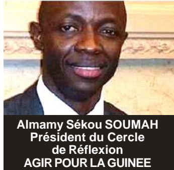
Monsieur le Président de la République,