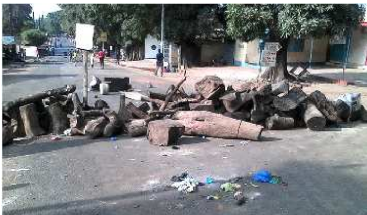
L'accord signé, la grève qui a fait 7 morts et des blessés, a été stoppée net par les syndicalistes de l'éducation.

La capitale guinéenne, Conakry, a été le théâtre de plusieurs mouvements de protestation lundi 20 février 2017, ainsi que durant les jours qui ont suivi. Des protestataires et des forces de l'ordre apparemment atteints d'une dose trop élevée de hargne, se sont livrés à des actes de vandalisme. Et pour cause ?