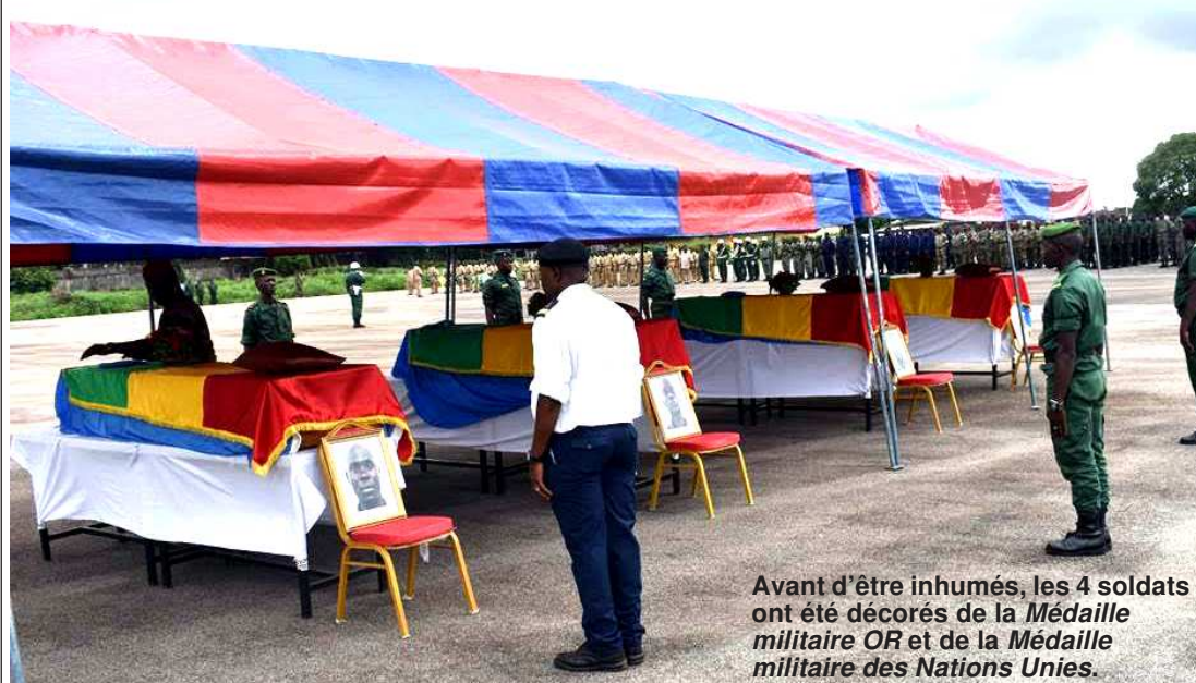
Avant d'être inhumés, les 4 soldats ont été décorés de la Médaille militaire OR et de la Médaille militaire des Nations Unies.

Les 4 soldats du contingent Gangan 2 sous l'égide des Casques bleus des Nations Unies tués par les terroristes à Kidal le 8 juin 2017, ont été inhumés vendredi 16 juin 2017 au Cimetière de Cameroun dans la commune de Dixinn à Conakry, après les