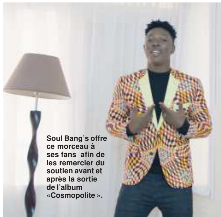
Soul Bang's offre ce morceau à ses fans afin de les remercier du soutien avant et après la sortie de l'album «Cosmopolite».