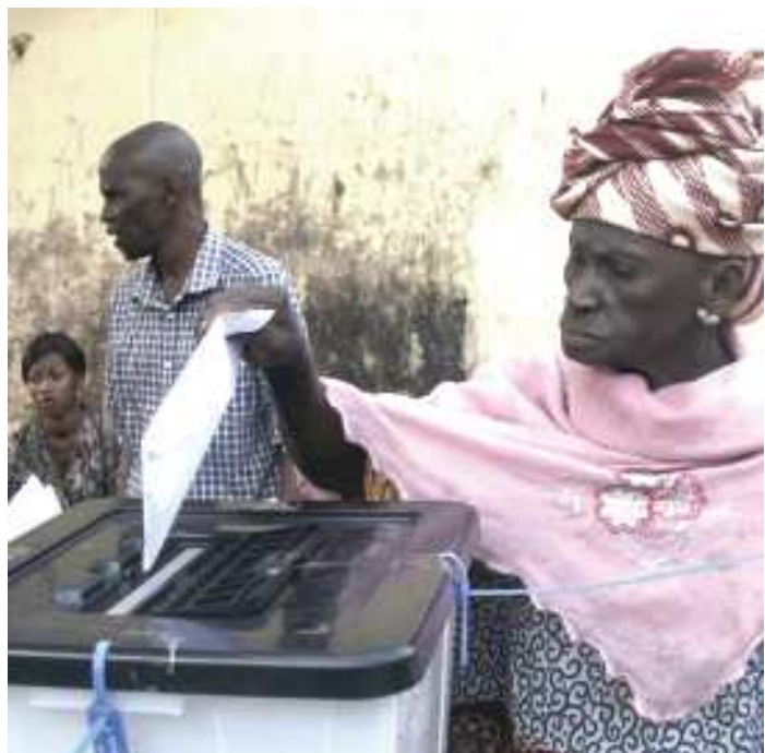
Les élections communales auront lieu le 4 février 2018.