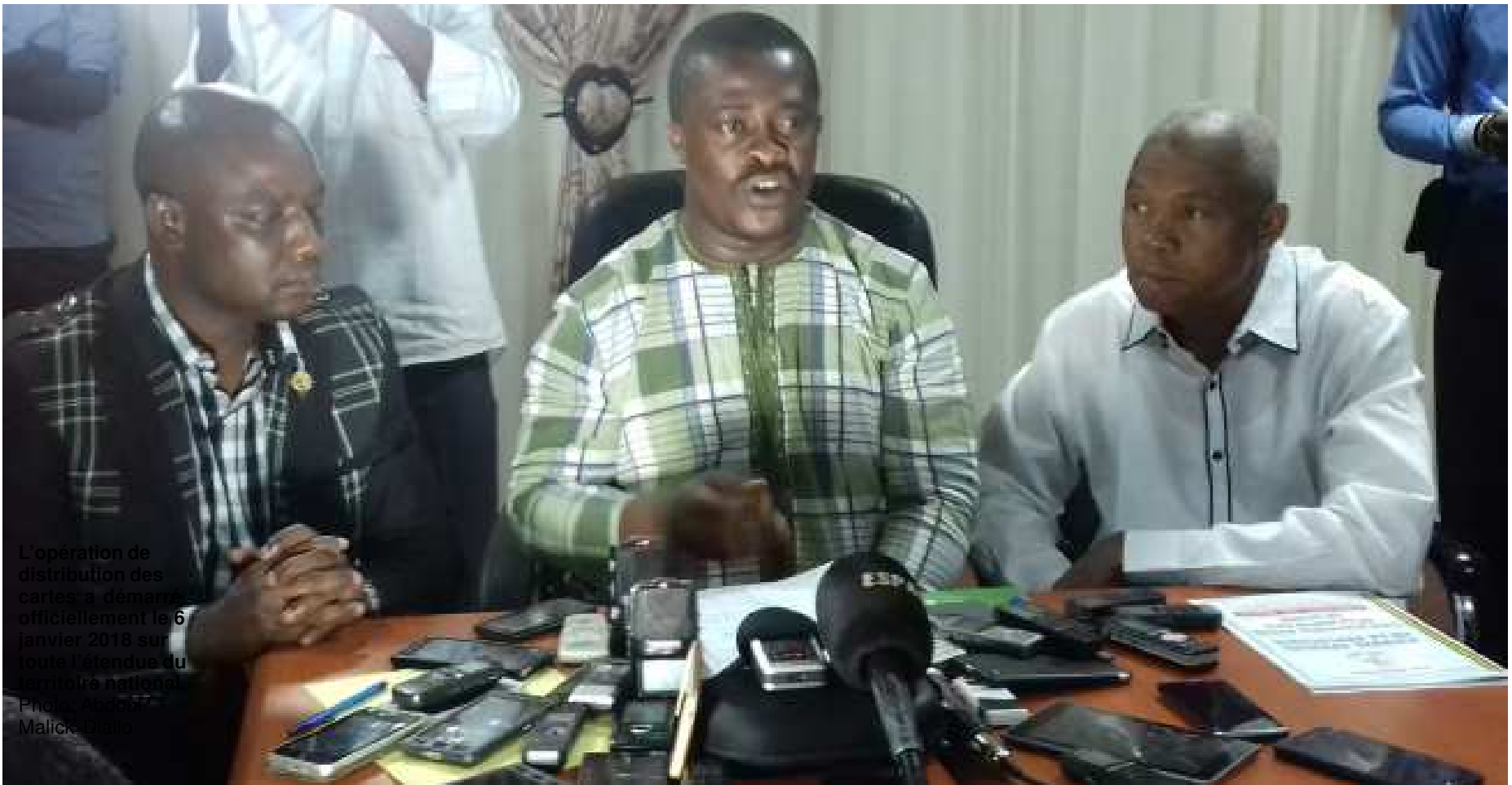
L'opération de distribution des cartes a démarré officiellement le 6 janvier 2018 sur toute l'étendue du territoire national.