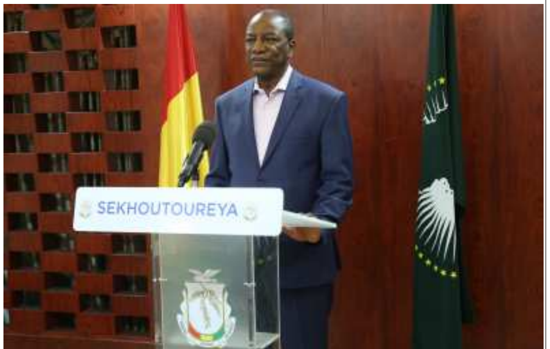
Notre programme de développement s'exerce aujourd'hui dans un contexte politique serein.