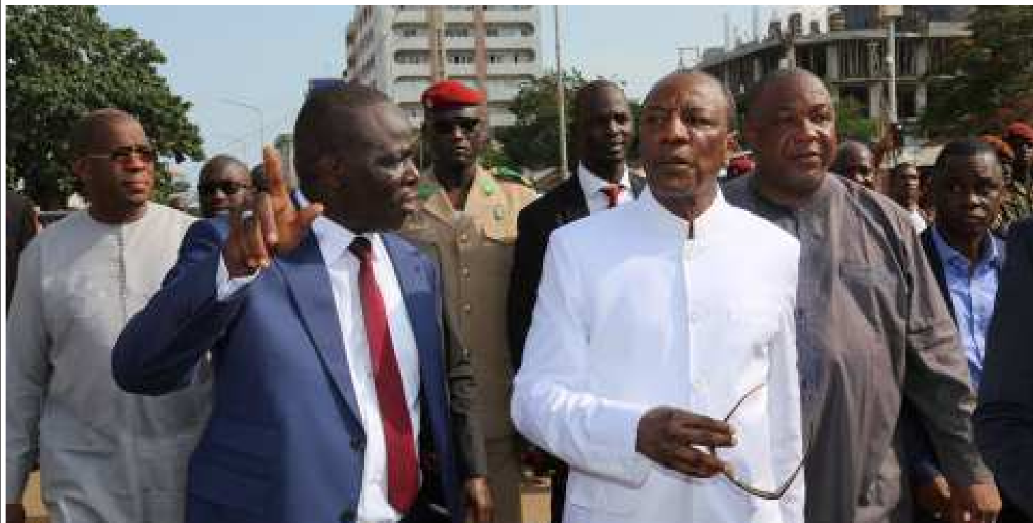
Un ensemble de projets sera mis en œuvre dès ce mois de janvier 2018, conformément à la volonté de l'Union Africaine de consacrer la nouvelle année au thème « investir dans la jeunesse ».

de développement économique et social (PNDES), la Guinée s'est vu accorder 21 milliards de dollars de promesses d'engagement en lieu et place des 14 milliards attendus. Après 24 années de fermeture, l'usine militaire de confection de tenues va s'ouvrir au camp Alpha Yaya, avec un coût de réalisation de 32 millions de dollars et la création de 1558 emplois.